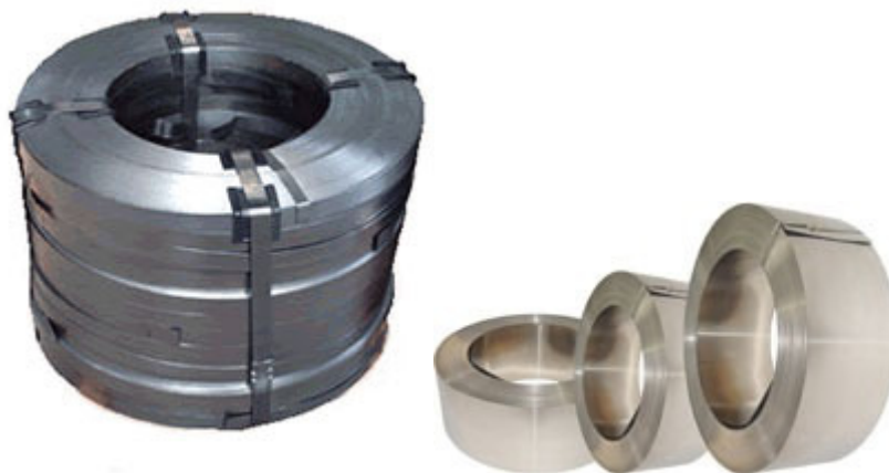
Fitas de aço galvanizado e aço inox 10, 13, 16, 19, 25 e 32 mm