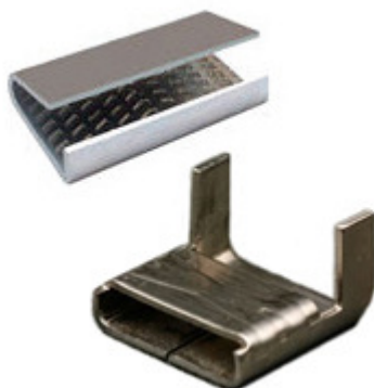
Selos VR, 35 mm e transpassados para fitas de aço ou plástico