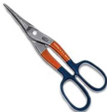
Tesoura para corte de aço