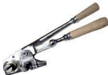
Esticador e selador em volume cilíndrico para fitas de aço de 10, 13, 16 e 19 mm