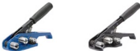
Esticadores para fitas PET de 13mm, 16mm e 19mm