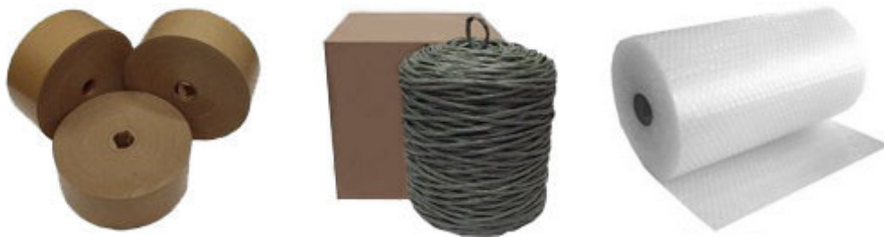
Fitas adesivas Fítilhos e Plástico bolha