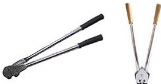
Seladores horizontal e vertical para fitas de aço