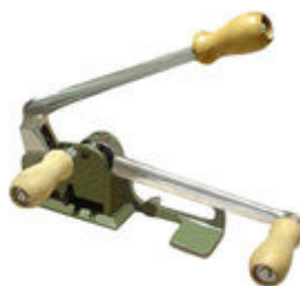
Aparelho conjugado para fitas de aço