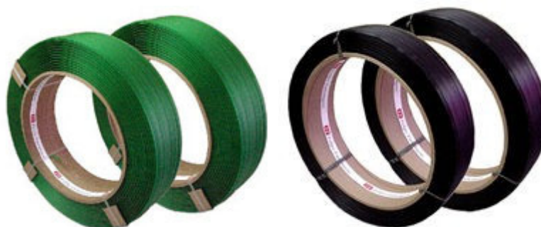
Fitas plásticas PET ou PP polipropileno 10, 13, 16, 19 e 25 mm de largura PET virgem ou reciclado